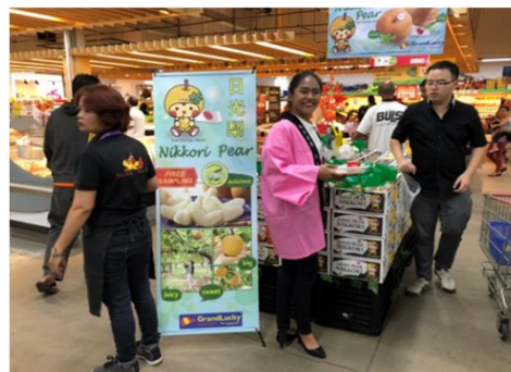
現地プロモーション（梨）