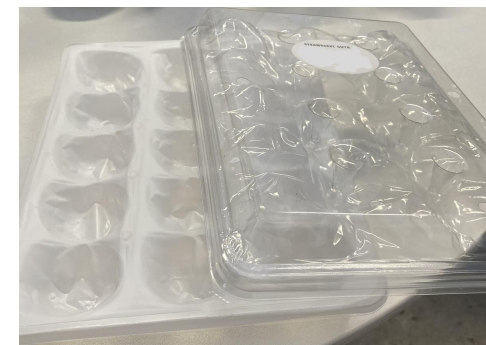
品質保持のための輸送資材（いちご）