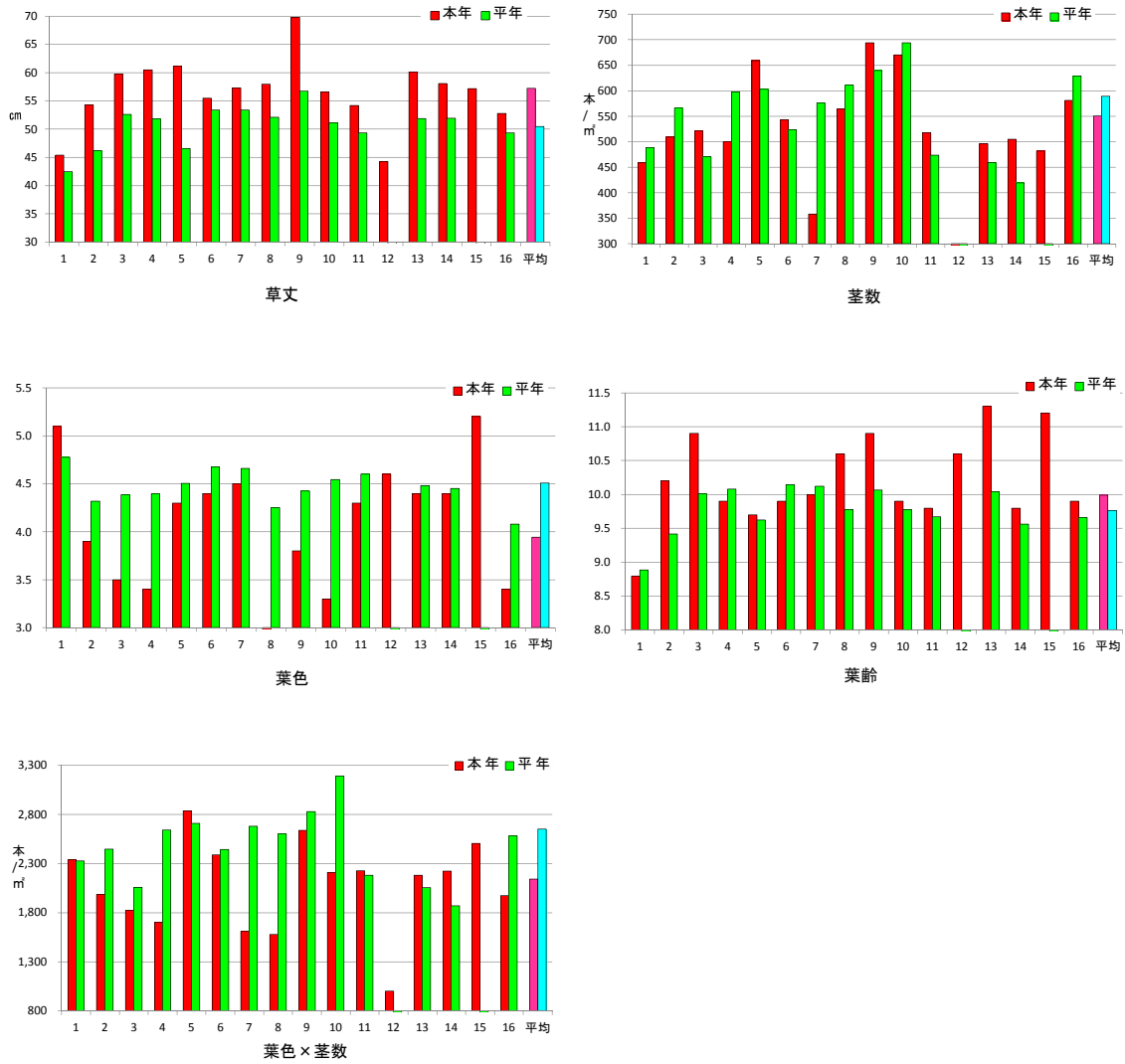
図1 各調査地点毎の平年値との比較