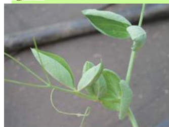
品目:さやえんどう 症状:葉がカップ状になる