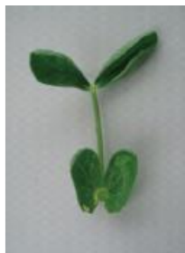
カップ状からさらに変形 =2