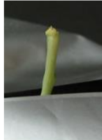
展葉なし（芯止まり） =4