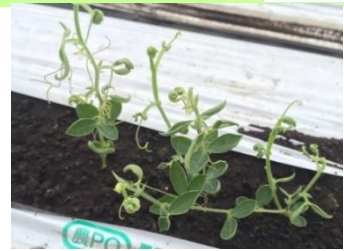
品目:スイートピー 症状:葉の異常