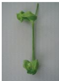
ひどく変形し原型をとどめない =3