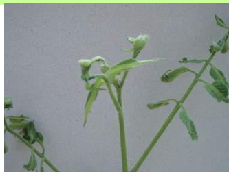
品目:トマト 症状:葉の異常