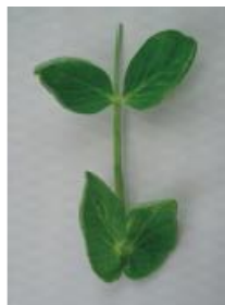
明らかにカップ状 =1