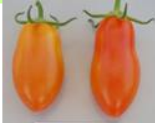
品目:ミニトマト 症状:果実が細長く変形