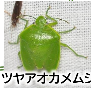
ツヤアオカメムシ