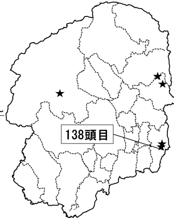
図: 令和5年度の陽性確認地点