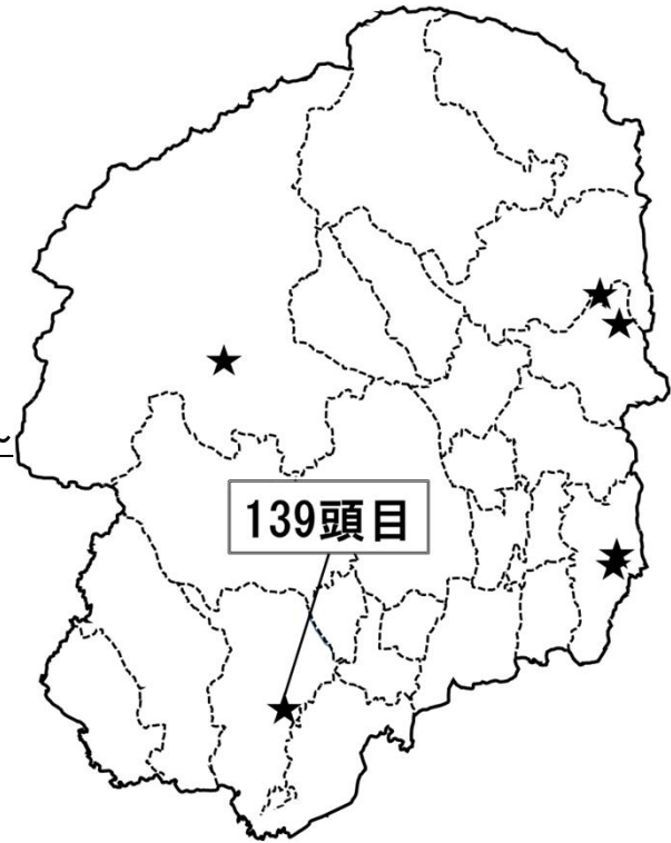
図: 令和5年度の陽性確認地点