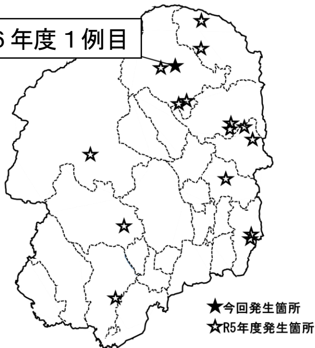
図：令和5年度以降の陽性確認地点