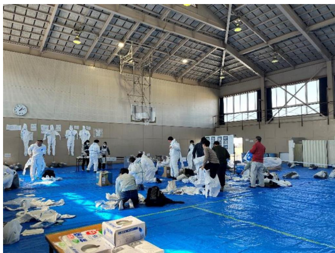
集合施設の様子 (2月17日)