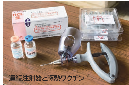
連続注射器と豚熱ワクチン