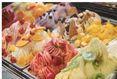
カフェ&ジェラテリア HoneyB ((有)黒田養蜂園直営)