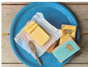
森林ノ牧場株式会社

那須地域の新たな産地バターの市場価値創出を目指した発酵バター (有塩・食塩不使用の2種類)