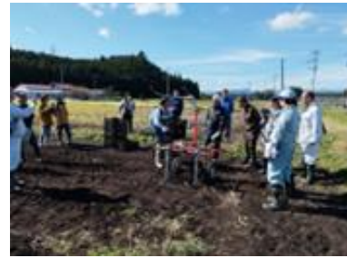
さといも省力機械検討会

対象名：JA かみつが各野菜生産組織、管内野菜生産者、野菜栽培志向農家、JA かみつが等