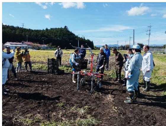
省力機械等導入検討会