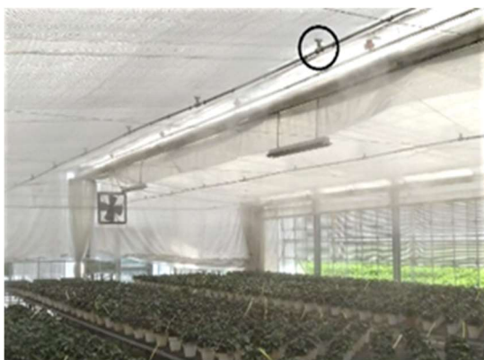
稼働中の細霧冷房