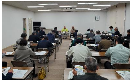
地域計画の先進地事例視察研修