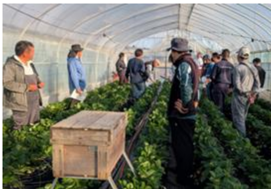
とちあいかの現地検討