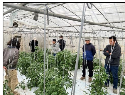
地区青少年クラブ視察研修会