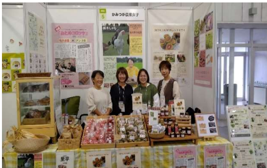
とちぎ食と農魅力発見フェア出展