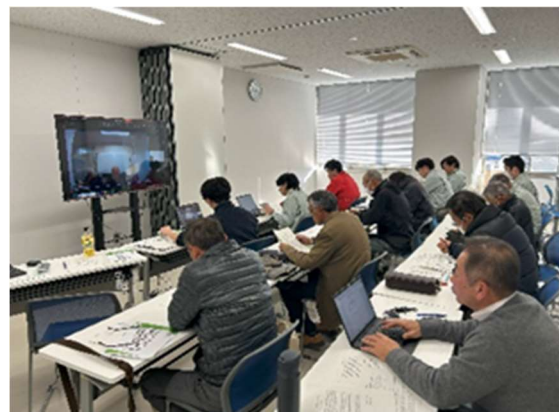
先進地意見交換（鳥取県）