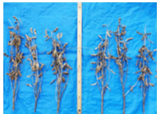
根粒菌接種の着莢効果 (左が接種区)