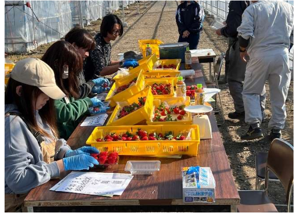
いちごのパック詰め体験