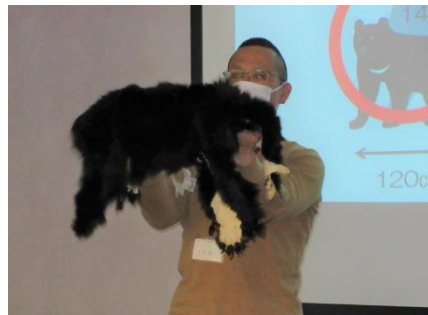
鳥獣害対策(クマ)研修会(12/1)