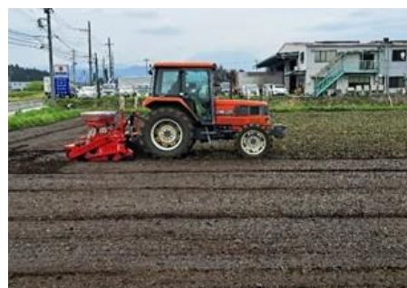
節水型乾田直播 播種作業