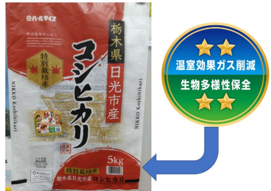
「みえるらべる」の活用