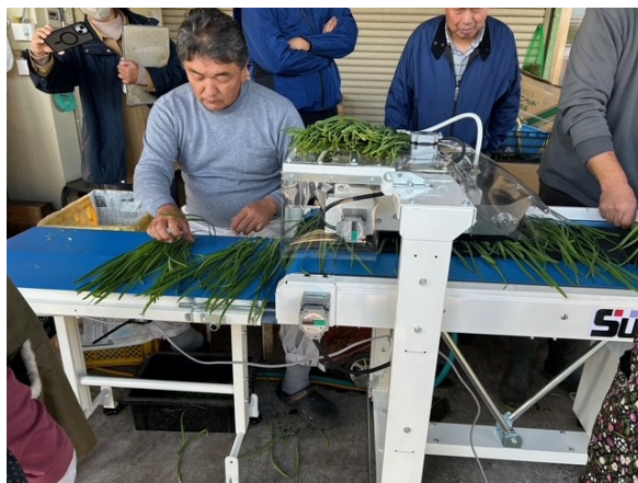
にらそぐり機実演会