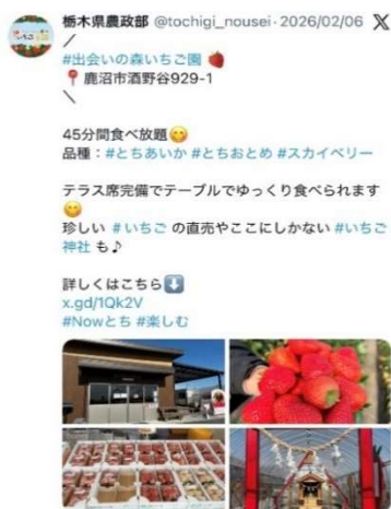
管内いちご狩り情報