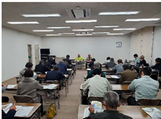
先進地事例調査（福島県）