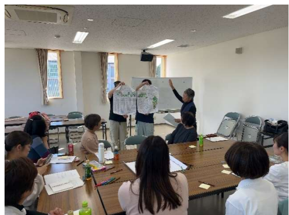
令和7年度女性意見交流会