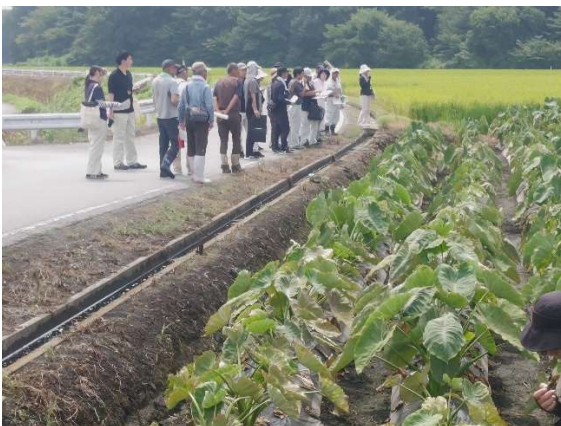
マルチ比較展示ほ見学会