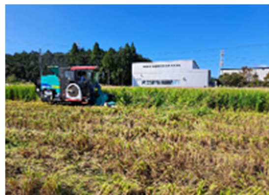
汎用型微細段飼料収穫機での作業