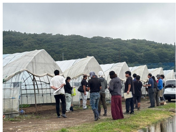
ほうれんそう遮熱資材検討会