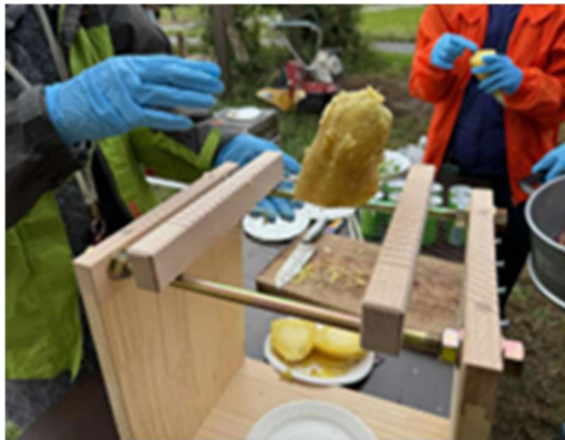
体験メニューの開発 (干し芋作り)