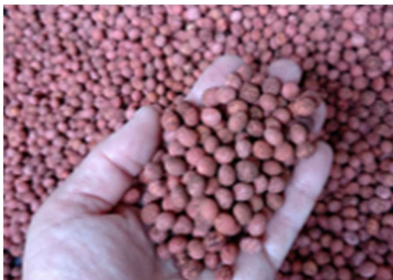
種子粉衣した根粒菌資材 (茶色粉状が根粒菌)