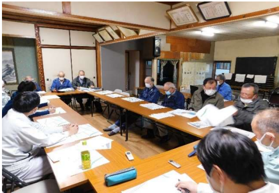
集積に向けた話し合い