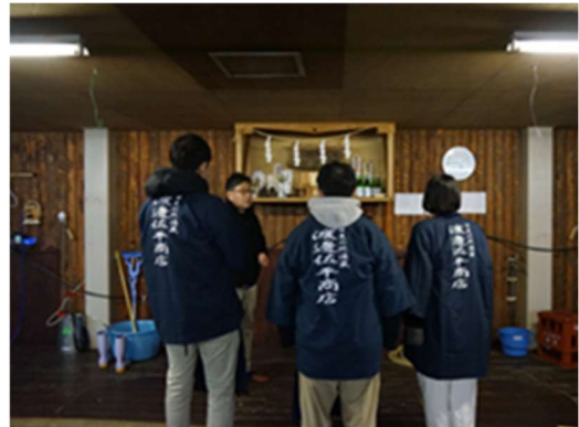
体験メニューの開発 (酒蔵見学)