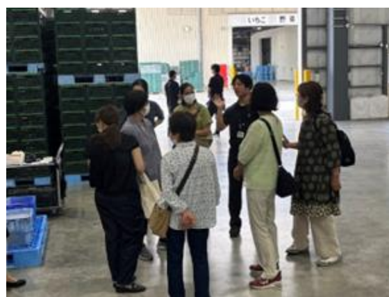
婦人部視察研修会