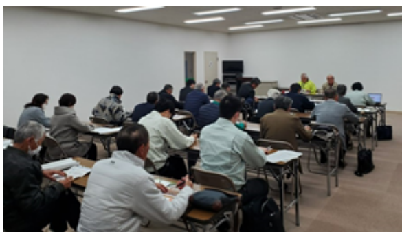
地域計画の実現に向けた視察研修