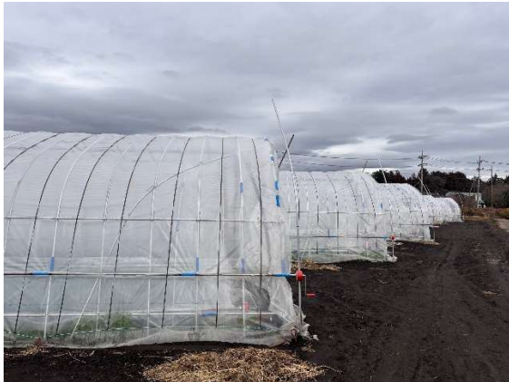
パイプハウスの整備