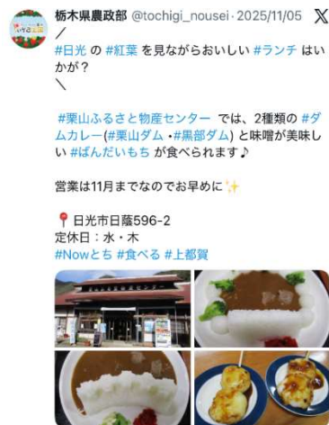
地元物産店の紹介