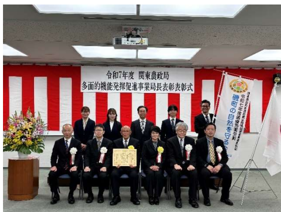
令和7年度関東農政局多面事業局長表彰 （最優秀賞）