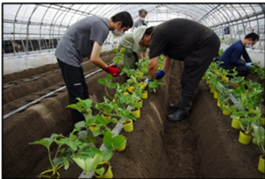
いちご栽培体験会