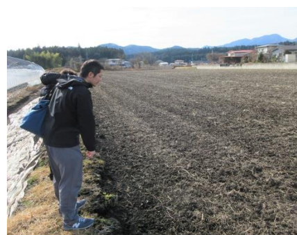
環直事業日光市抽出検査(12/23)