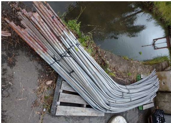
中古施設を解体して得られた資材