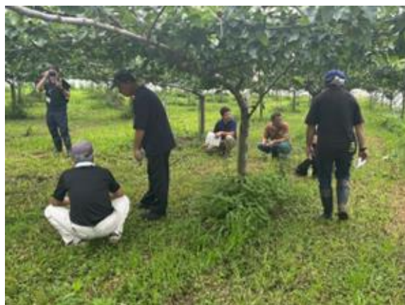
「新一文字整枝法」の現地検討