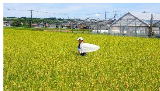
斑点米カメムシ類の発生実態を把握