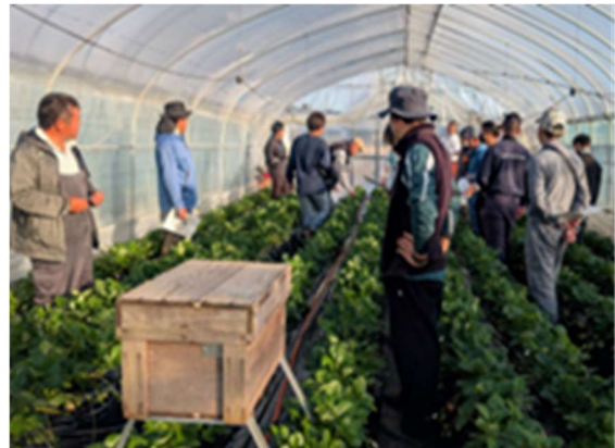
とちあいか作付け推進記事

その他、とちあいかの栽培に関する御相談は、上都賀農業振興事務所までお問い合わせください。