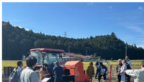
さといもの実演会