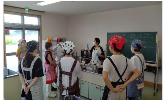
料理教室「ごはんのお供 COOKING」