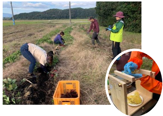
農泊等の新たな農村ビジネス