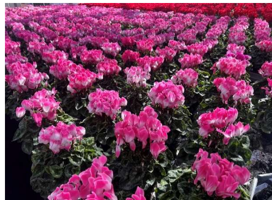
出荷期を迎えたシクラメン