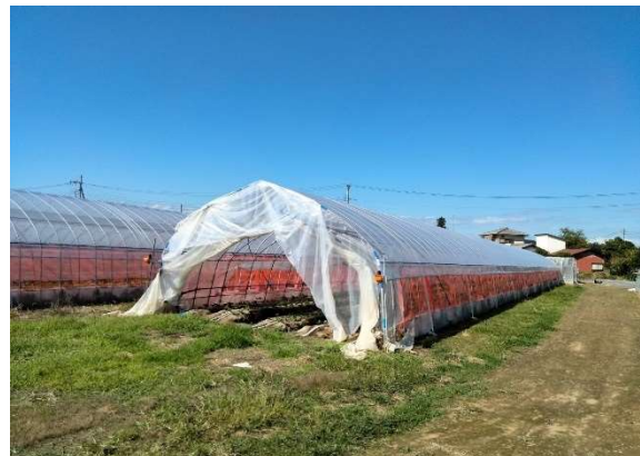
中古施設の資材を活用して 修繕されたハウス