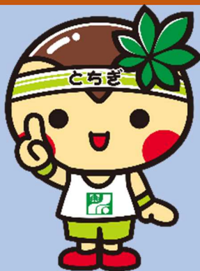
とちまるくん © 栃木県