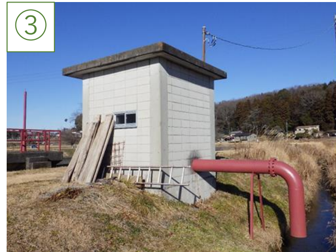
飯下の揚水ポンプ