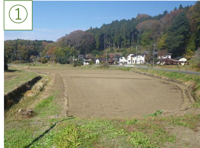
下菅又の小区画圃場