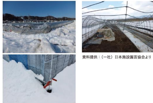
資料提供：(一社)日本施設園芸協会より

https://www.pref.tochigi.lg.jp/g04/kisyousaigai/ametaisaku.html