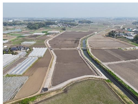
( 完成したほ場の様子 )