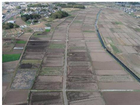
( 地区上流側 )