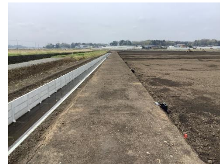
( 水路管理のための幅広溝畔 )