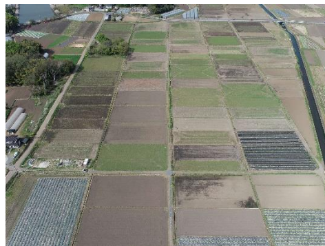
( 地区下流側 )