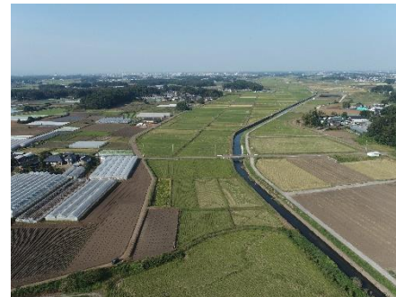
( 施工前ほ場の様子 )