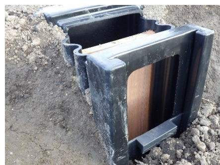
( 田んぼダム用排水口 )