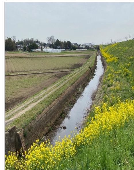
(整備前排水路 最下流部)