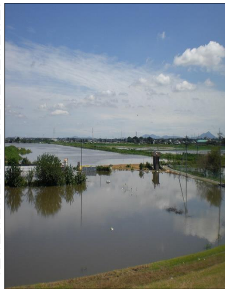
(令和元台風時の様子)