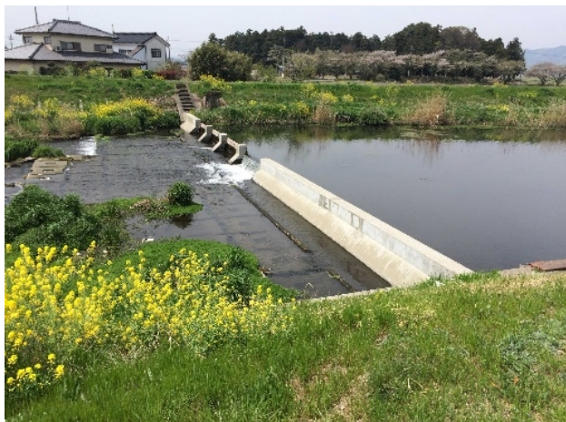
( 亀の子堰の全景 )

急激な増水時に固定堰角落しによる開放操作が困難となる等、治水上の安全性が確保されていない状況にある。よって、治水の安全性を確保するため、確実な水管理を行える取水堰に早急に改修する必要がある。