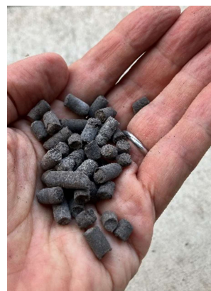
豚ふんペレット堆肥

※「令和5(2023)年度 とちぎグリーン農業推進実証展示ほ 成果情報」から抜粋