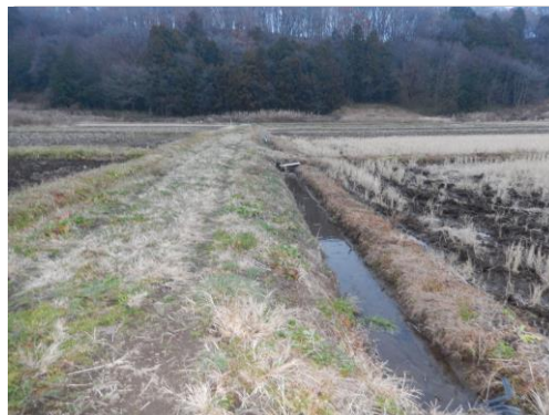
用排兼用の土水路