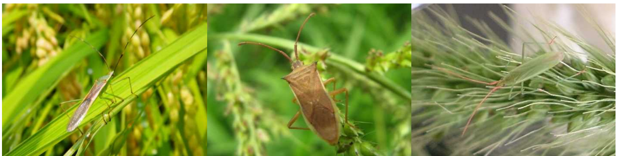
写真 2 栃木県の主要な斑点米カメムシ類 (左からクモヘリカメムシ・ホソハリカメムシ・ アカヒゲホソミドリカスミカメ)

穂揃期に斑点米カメムシ類が水田内で見られる場合は、薬剤を散布しましょう。その後も斑点米カメムシ類が見られる場合は、7~10 日間隔で追加散布をしましょう。