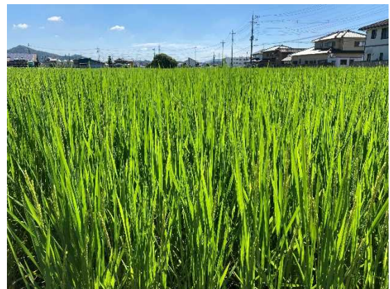
写真1 水稲生育診断ほ場の様子