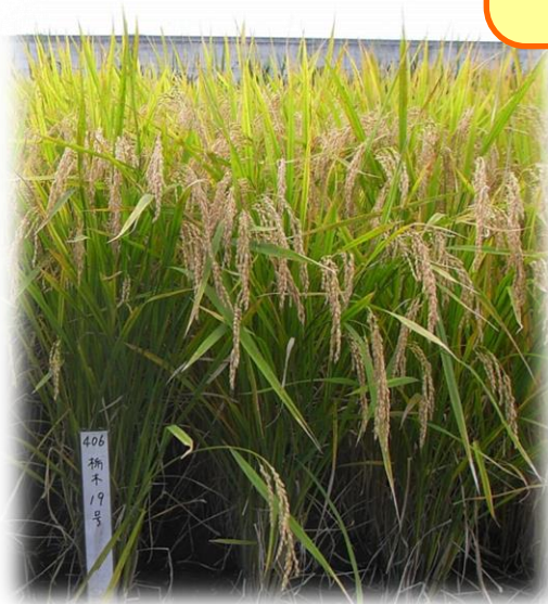
水稲新品種「とちぎの星」 (平成27年3月26日品種登録)