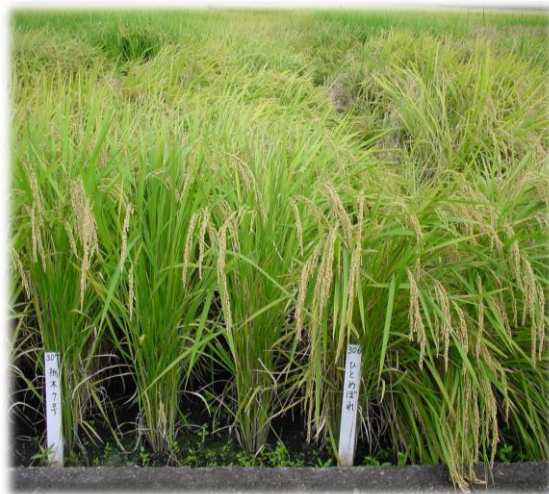
水稲「なすひかり」左側 食味最高評価“特A”6年連続取得