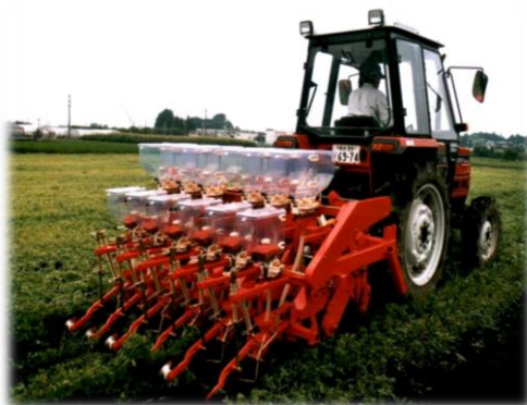
大豆の不耕起・無中耕・無培土栽培