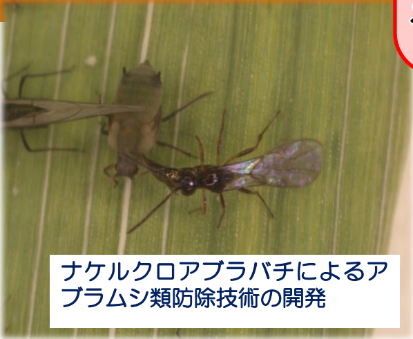
ナケルクロアブラバチによるアブラムシ類防除技術の開発

環境にやさしい農作物の病害・虫害防除及び発生予察技術に関する研究を行っています。