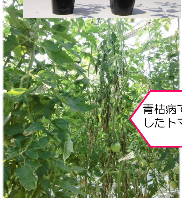
青枯病で萎凋したトマト