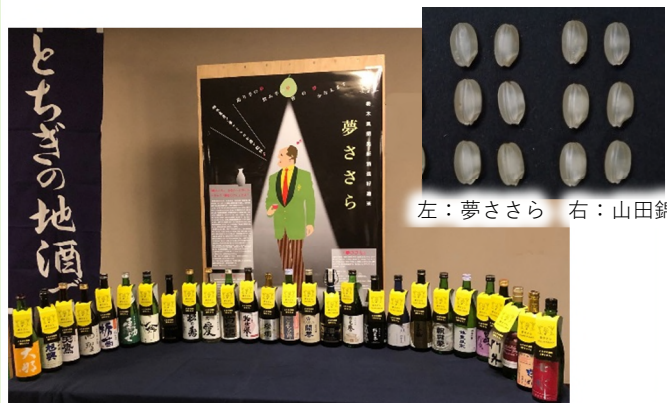
左：夢ささら 右：山田錦