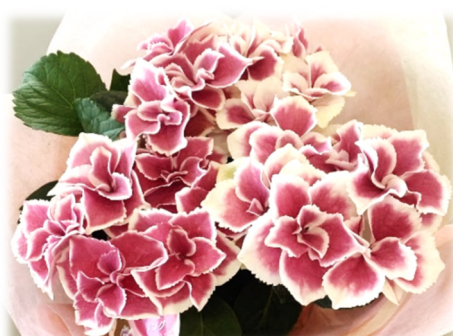
プリンセスリング