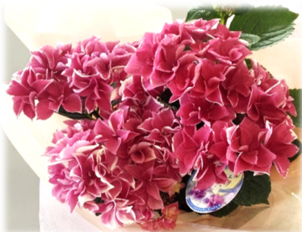
エンジェルリング