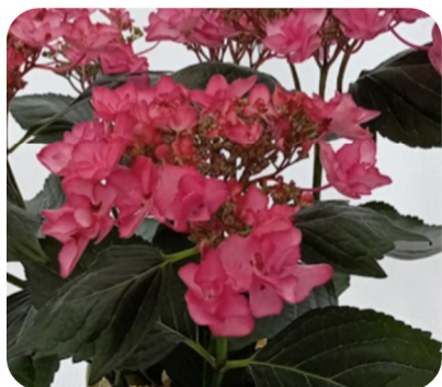
キャンディポップ