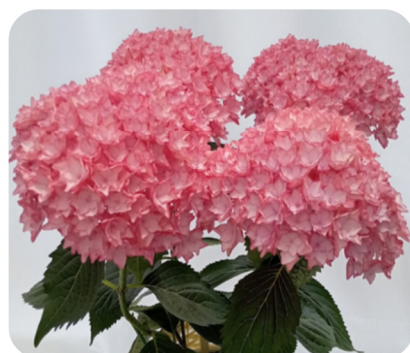
ジュエリーポップ