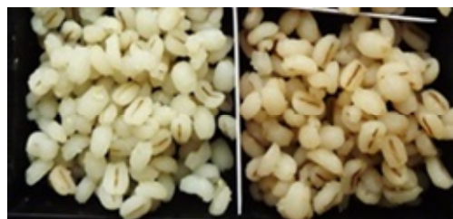
もち絹香 サチホゴールド 炊飯 12 時間後の色相