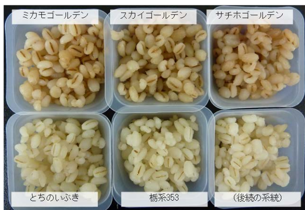
図-1 「栃系 353」の炊飯麦の褐変化の様子 (炊飯 12 時間後)