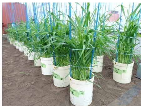
写真 麦のポット栽培 (この後、高温処理を実施) (麦類研究室)

そこで、ワグネルポット (1/5000a) で養成した大麦育成系統を用いて、不稔が発生しやすい出穂期頃に高温に曝し、不稔の発生程度を調査することで、不稔耐性に優れる系統の選抜を行っています。また、選抜法が確立すると、不稔耐性に優れる系統とそうでない系統の不稔の発生程度の差を利用し、不稔耐性に関する遺伝子解析を進めることができます。今後は、選抜に有効な DNA マーカーを開発し育種に導入することで、より効率的な品種育成を目指します。