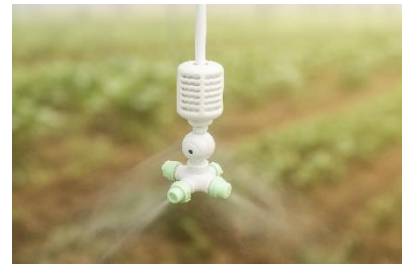
写真1 クールネットプロ