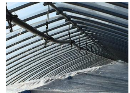
写真2 ウォーターカーテン