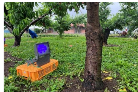
図2 ほ場での紫外光照射の様子