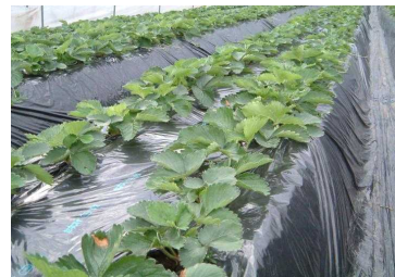
写真 株元にマルチをした状況

植えた後1ヶ月程度でハウスの屋根のビニールをはり、株元にマルチ（ビニールでベットの覆う）をします。