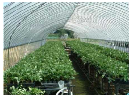
写真 苗を育てている様子