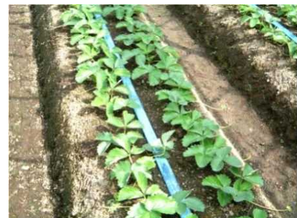
写真 定植後のハウス内