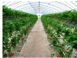
写真2 空中採苗方式