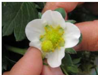
花粉をかけあわせる