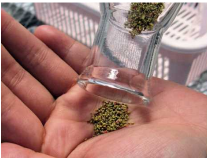
果実から「そうか※」をとる