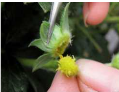
雄しべをとりのぞく

2月から3月に母親にする花の雄しべをとりのぞき、父親にする花の花粉をつけ受粉します。受粉後は袋をかけて、他の花粉がつかないようにし、4月に赤く色づいた果実から種をとります。