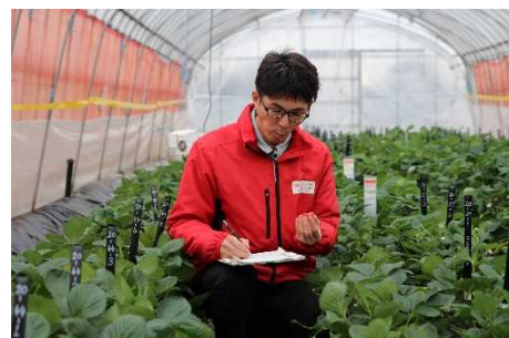
いちごの調査のようす