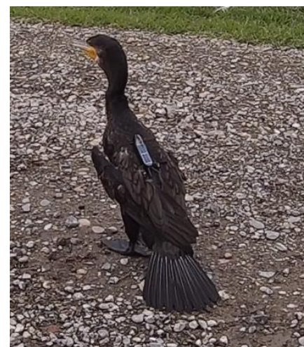
ロガーを装着したカワウ