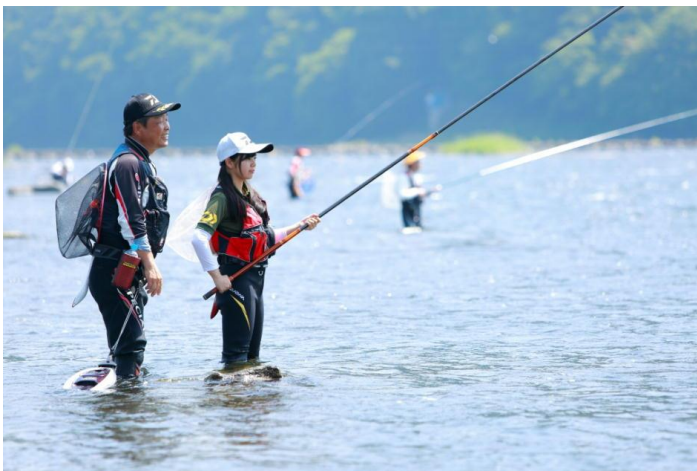
アユの友釣りを楽しむ女性遊漁者