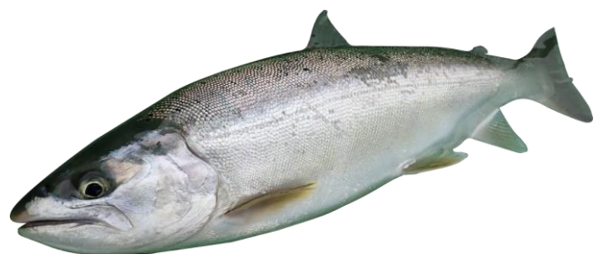
管理釣り場向けに開発した全雌三倍体サクラマス

ホンモロコやキンブナなど水田を活用した養殖漁業に対して、安定的な生産のために技術支援します。