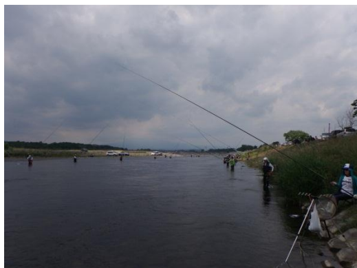
勝山地区のようす