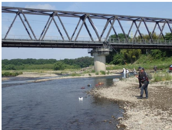
両毛線下流のようす

[参考] H27年5月17日（解禁日）の平均釣獲尾数は1.96尾、釣獲魚の大きさは全長12~20cmでした。