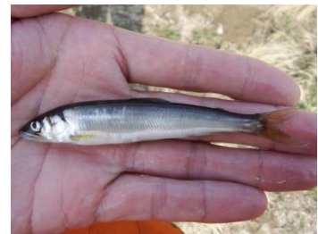
採捕された天然遡上アユ (左：茂木地区、右：境頭首工)