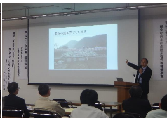
安田先生による講演