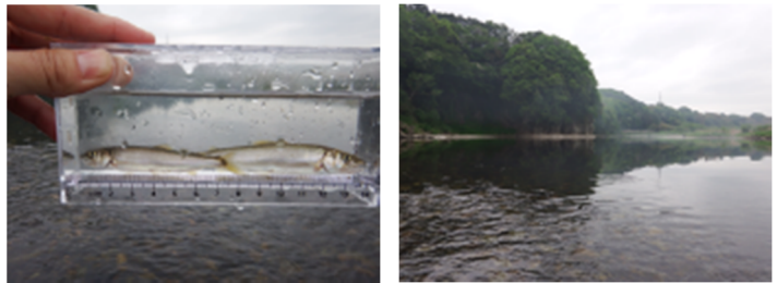
茂木地区 | テイテイ淵

・5月7日に引き続き、那珂川茂木地区で天然遡上アユを採捕しました (5/14)。