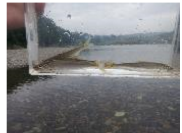
茂木地区 | テイテイ淵