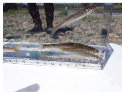
茂木地区 | テイテイ淵