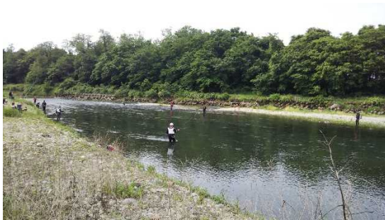
なら山沼漁場付近の様子