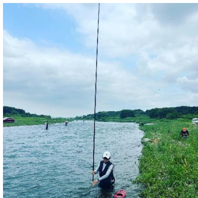
養魚センター下流のようす