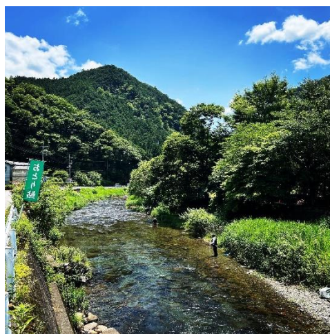
鈴木商店付近のようす