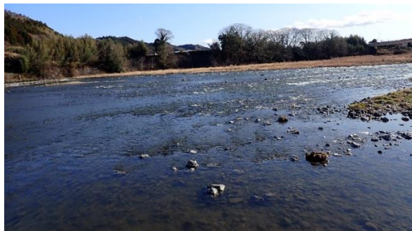
烏山地区・境堰 (水温: 12.2℃)