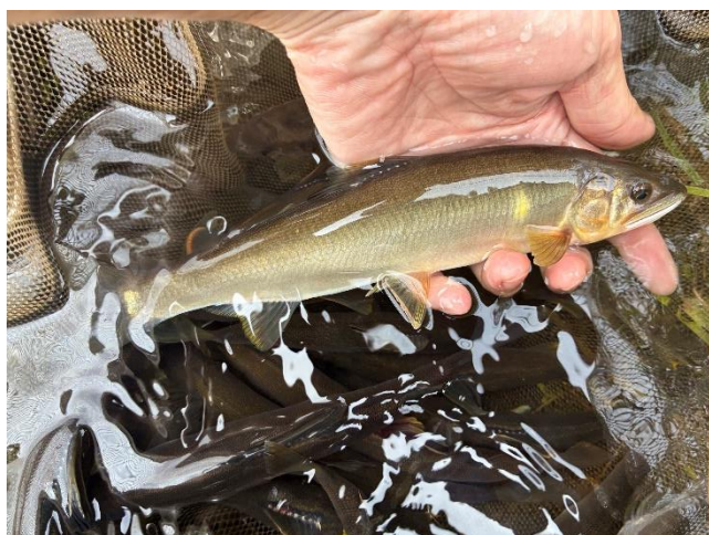
釣獲アユ（葉鹿橋付近）