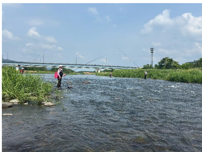
葉鹿橋付近の様子