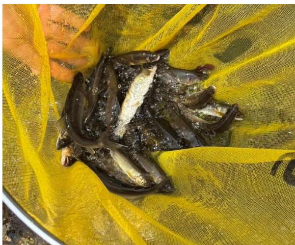
釣獲アユ（清洲橋付近）