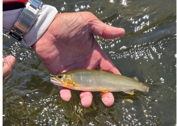
烏山地区 (烏山大橋付近) で釣獲されたアユ1