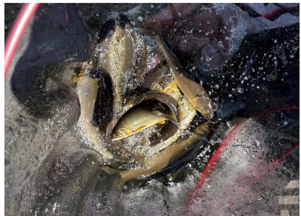
烏山地区 (烏山大橋付近) で釣獲されたアユ2