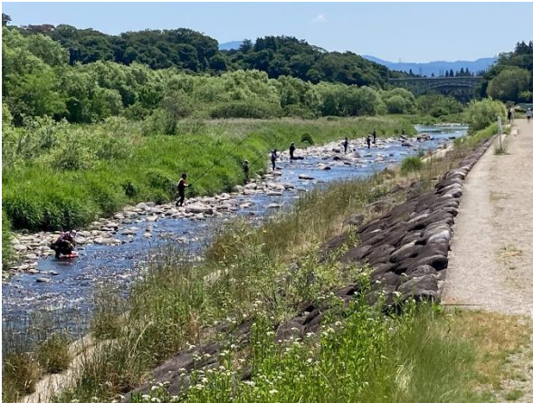
黒磯地区 (那珂川河畔公園) の様子