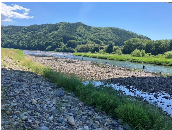
烏山地区 (烏山大橋付近) の様子