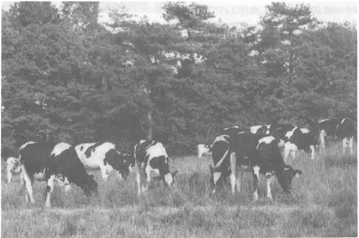
優良乳用牛受精卵活用効率化事業の育成牛放牧（南那須育成牧場）