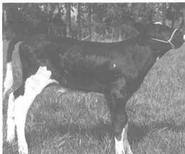
誕生した娘牛（父：ファタール）

この子牛の母親（No.601）は、平成5、6年度に北米から導入した8頭のうち1頭で、初産乳量1万kgの成績を持つスーパーカウです。他の牛同様、娘牛の生産がたいへん期待されていましたが、この牛は通常の採卵では受精卵が数多く採れず、後継牛の確保に苦労していました。