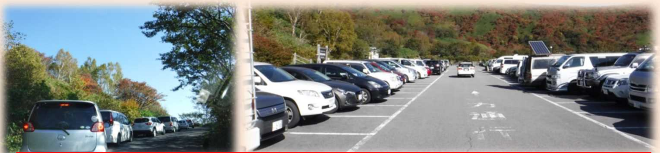
那須ロープウェイ付近の渋滞状況及び峠の茶屋駐車場の満車状況(AM7時台)