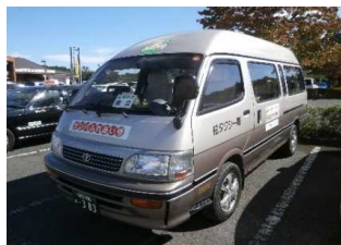
市貝町デマンド交通 サシバふれあい号