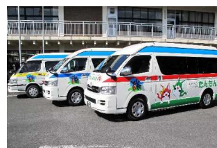
高根沢町デマンド交通 たんたん号