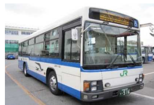
JRバス関東 水都西線