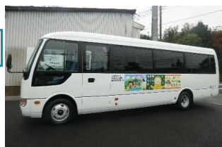
那須烏山市営バス 市塙黒田烏山線