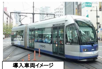
導入車両イメージ