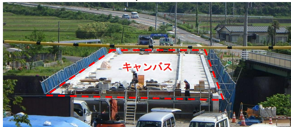
現場状況 (箒川右岸側から堰場橋の橋面を望む)