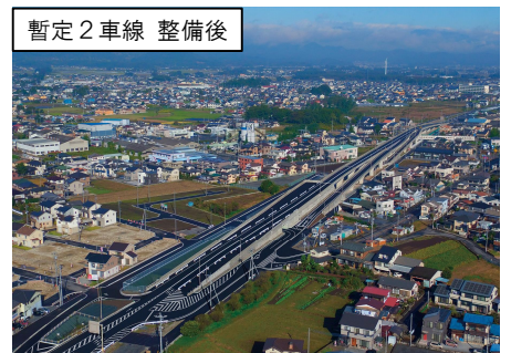
(都)小山栃木都賀線の供用区間の状況 (栃木市平柳町工区)