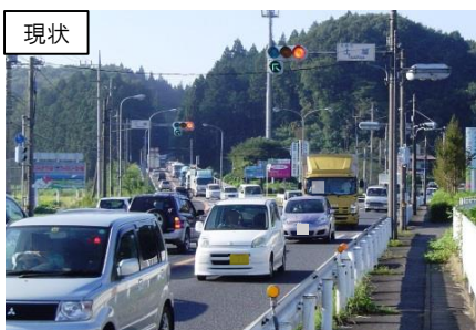
矢板市 土屋地区（矢板大田原バイパス）