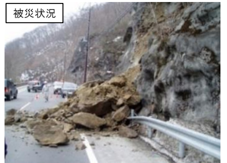
落石危険箇所の対策（日光市五十里）