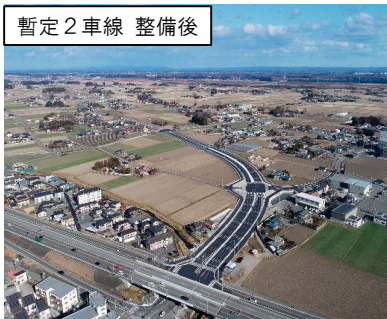
産業拠点と地域高規格道路を結ぶ道路整備 (宇都宮市平出板戸工区)