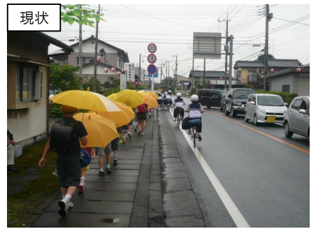
通学路の歩道整備（壬生町大師町）