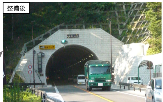
災害に強い幹線道路の整備 (那須塩原市下塩原バイパス・供用済区間)