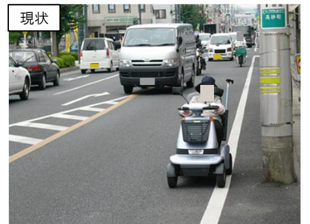
事故危険箇所の対策（佐野市高砂町工区）