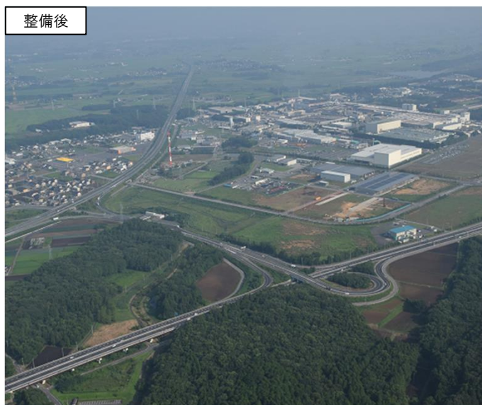
北関東自動車道真岡 I C と国道408号沿線の工業団地群