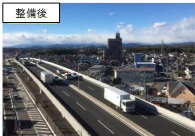
供用区間の状況（宇都宮環状北道路・下川俣陸橋）