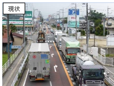
那須塩原市 三島地区（西那須野道路）