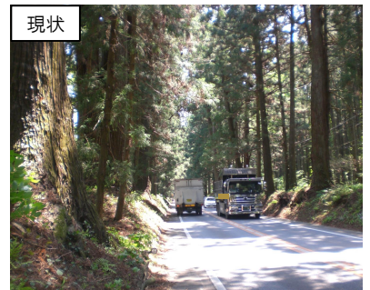
日光杉並木街道のバイパス整備 (日光市水無バイパス)