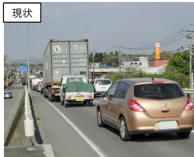
産業拠点とIC周辺の渋滞対策 (壬生町若草町工区)