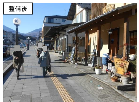
観光地の街並み景観整備 （日光市中心部の電線共同溝整備）