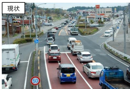
矢板市 中地区（矢板拡幅）