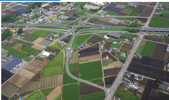
(仮称) 下野スマート I C の完成イメージ