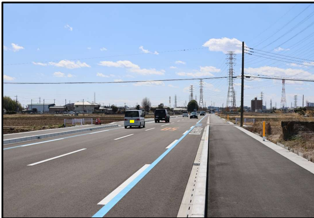
中間地点から南(JR小山駅方面)を望む