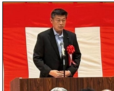
白石隆資 栃木県議会副議長