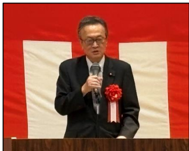
船田元 衆議院議員